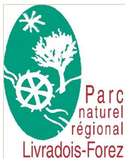
Logo du commanditaire de l'étude