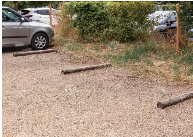
Figure 1: cloisonnement