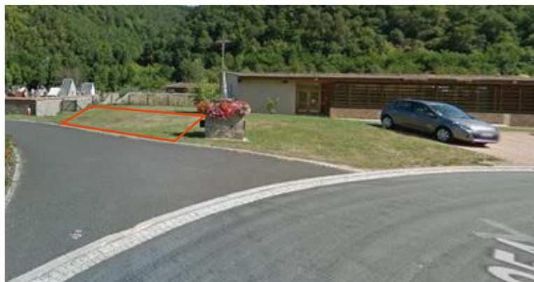
Figure 3 : Vue de la rue