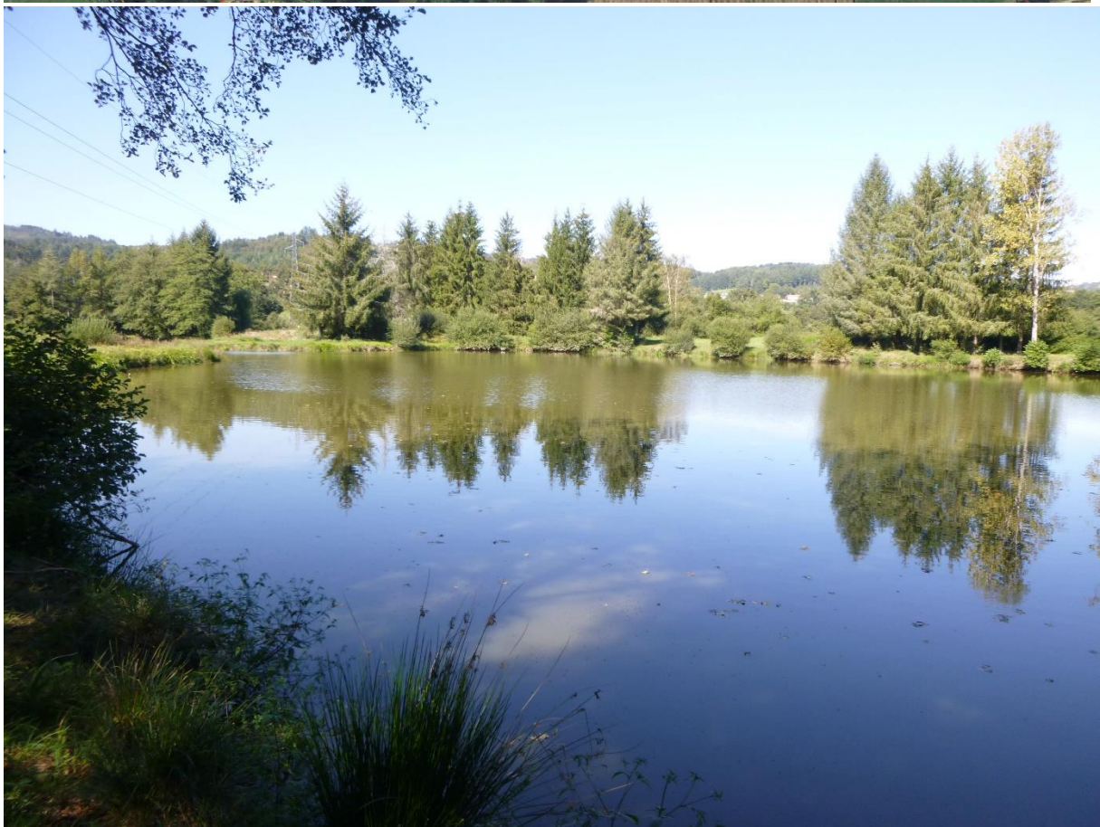
Photo du plan d'eau ouest