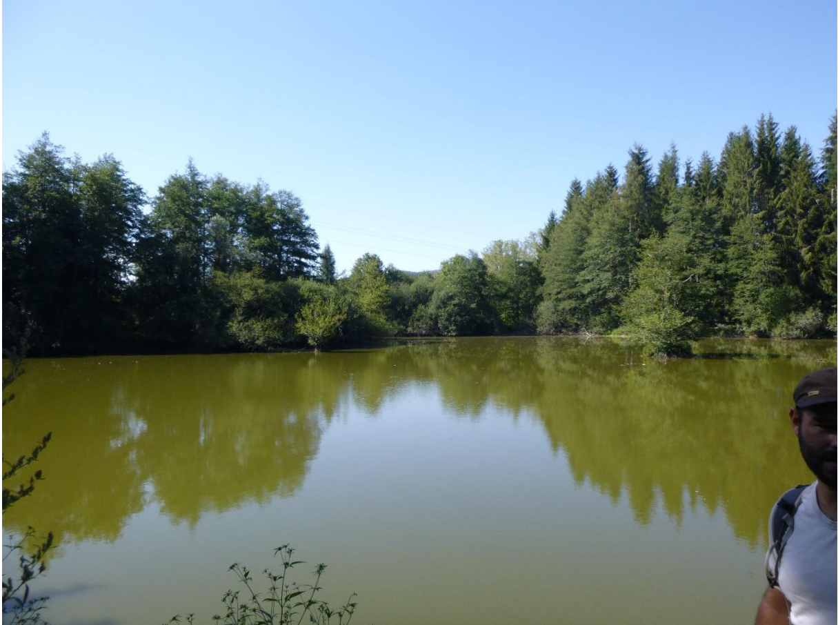
Photo du plan d'eau Est

Les poissons de type carpe, tanche ... seront remis dans le plan d'eau appartenant à la fédération de pêche sur la commune de Aix La Fayette à 30min du site.