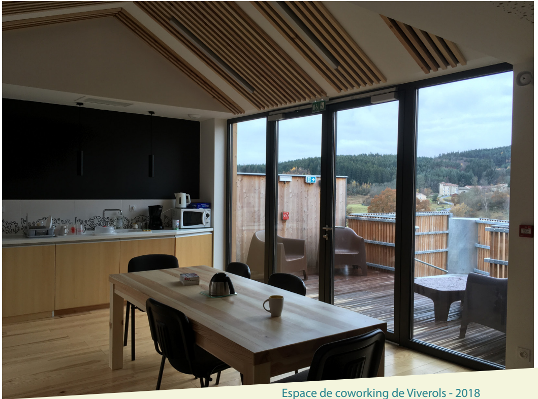
Espace de coworking de Viverols - 2018