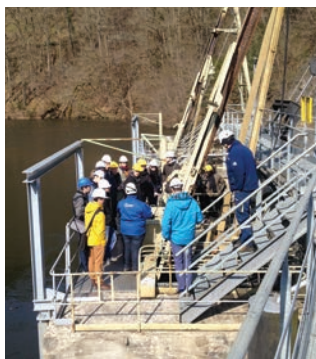
Semaine Ide résidence