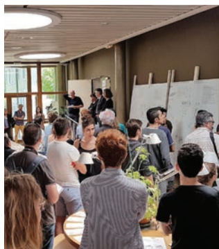
Vernissage de l'exposition