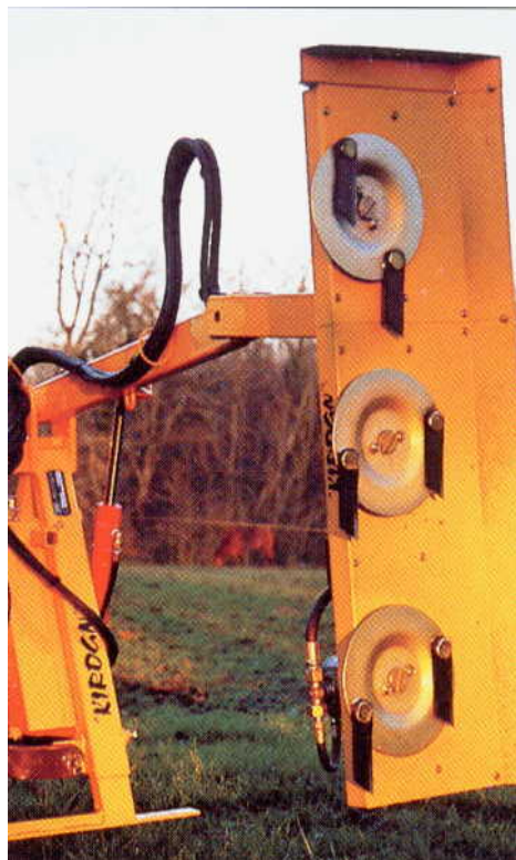
Lamier à couteaux : hauteur de coupe : 2 m