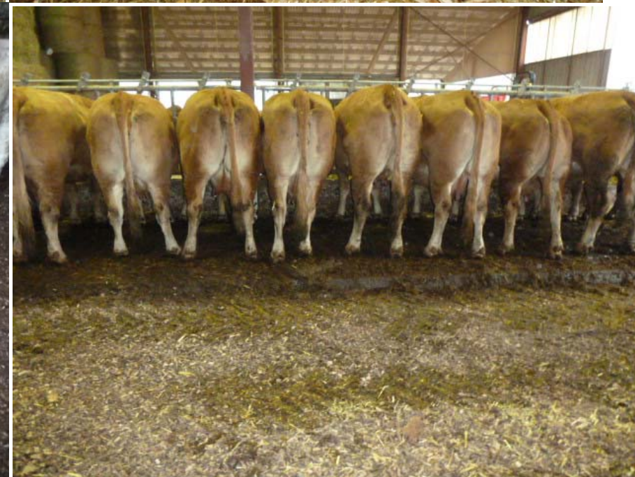
Illustration de vaches sur plaquettes issues de haies.