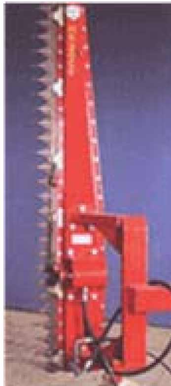
Sécateur hydraulique : costaud, coupe des diamètres jusqu'à 7 cm.