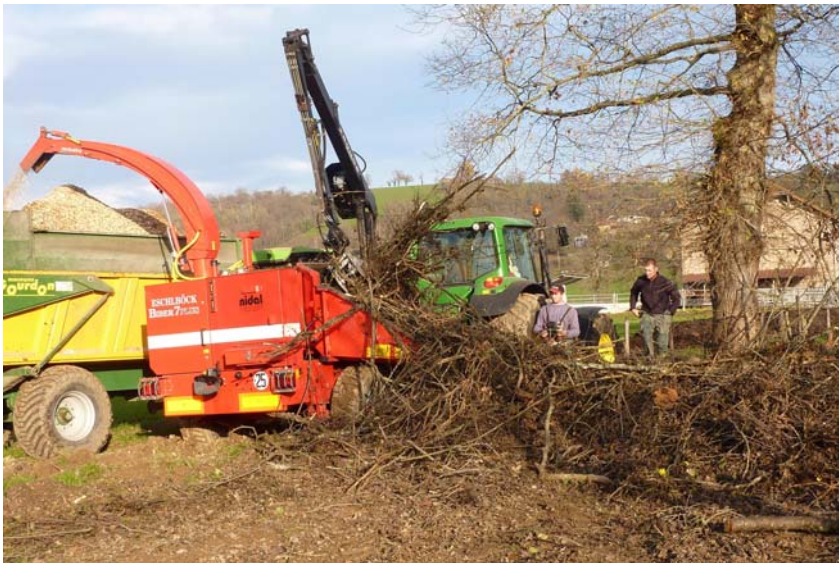
Déchiqueteuse avec grappin hydraulique (sur la photo, déchiqueteuse BEEBER 7 plus). Coût CUMA des DEUX ROCHERS : 175 €/heure.