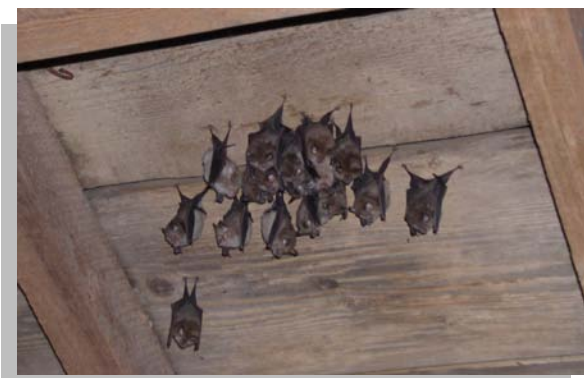
Site de reproduction de Petits Rhinolophes

Les chauves-souris changent de lieu de vie au cours de l'ann e :