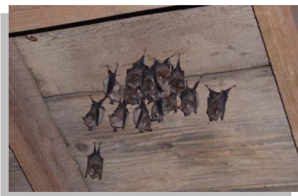
Site de reproduction de Petits Rhinolophes

Les chauves-souris changent de lieu de vie au cours de l'année :