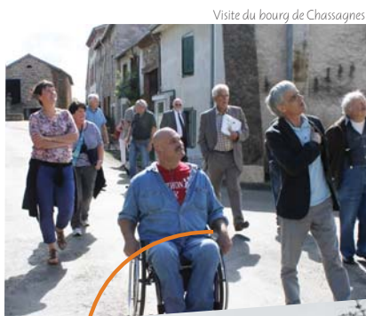
Visite du bourg de Chassagnas