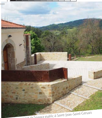
Aménagement de l'espace public à Saint-Jean-Saint-Gervais