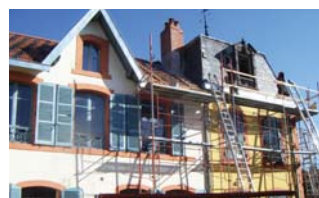
Réhabilitation de la bibliothèque et création d'un logement communal à Saint-Jean-des-Œilières

Vous souhaitez créer une dynamique collective autour des usages et besoins à conforter et à développer dans votre centre-bourg.