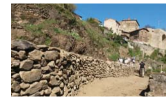
Chantier participatif, réfection du chemin de ronde en pierres sèches à Auzon