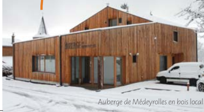
Auberge de Médeyrolles en bois local

Cette cellule est intégrée au pôle aménagement du Parc qui regroupe des chargées de mission en architecture, paysage, centre-bourg, énergie et urbanisme. Elle a également un rôle d'animation et de coordination des différents partenaires techniques de l'Atelier d'urbanisme.