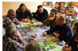
Opération centre-bourg à la Monnerie-le-Montel

L'Atelier est un collectif aux compétences complémentaires dans les domaines de l'aménagement, de l'architecture, de l'urbanisme, du paysage et de l'énergie. Il vous conseille et vous accompagne sur les aspects réglementaires et techniques pour :