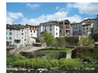
Projet de centre-bourg à Olliergues

Vous souhaitez élaborer, réviser ou modifier votre Plan local d'urbanisme communal ou intercommunal.