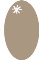
Bastien BONNAND - 5800 Projectionniste Ciné Parc