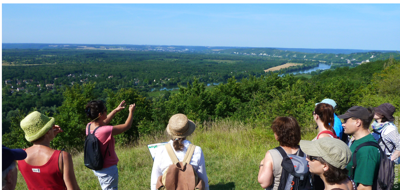
Photographies extraites du film de la campagne publicitaire sur Facebook