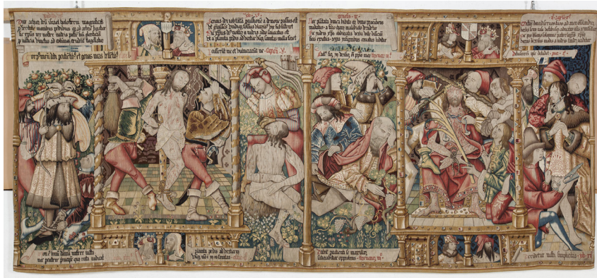
Tapissierie V, La flagellation et le couronnement d'épines, laine, lin, soie et fils métalliques, 206,5 x 405,5 cm XVIIe siècle, Abbaye de La Chaise-Dieu.

Nous vous donnons rendez-vous en juillet 2018 pour redécouvrir les tapisseries de La Chaise-Dieu, qui seront présentées à nouveau, cinq cents ans exactement après leur première présentation en 1518.