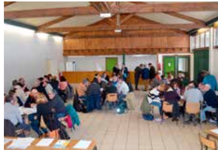
Schéma de Cohérence Territoriale, le SCoT – dont le périmètre regroupe trois intercommunalités (Entre Dore et Allier, Thiers Dore et Montagne et Ambert Livradois Forez) fixe un cadre pour un

aménagement du territoire plus équilibré et solidaire, dans le respect des principes du développement durable et du Grenelle de l'environnement. Cœur du projet : améliorer le cadre de vie et répondre aux besoins des habitants en vue aussi d'attirer de nouvelles populations. En 2017, les élus ont élaboré ensemble un projet d'aménagement et de développement durable (PADD) pour les vingt prochaines années. Dès cet automne, ils travailleront pour dessiner les objectifs et les orientations en lien avec le projet défini dans le PADD. Le SCOT sera ensuite soumis pour avis aux différents partenaires, la population sera consultée et, une fois approuvé, devra être mis en œuvre. Les documents d'urbanisme communaux et intercommunaux (PLU(i)) devront ainsi être compatibles avec le SCoT.