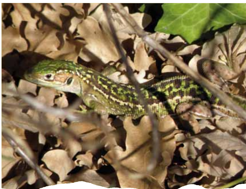
Lézard vert (juvénile)