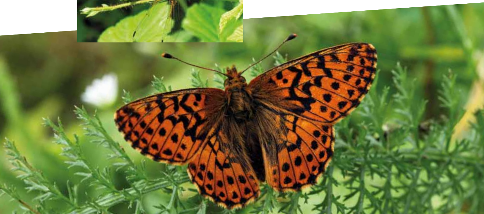
Nacré de la canneberge

→ Organiser les prospections par grand type de milieu pour y rechercher les espèces inféodées à ces milieux (milieux d'altitude, tourbières et lacs tourbeux, étangs de plaines, rases et ruisselets en prairies, rivières Allier et Dore, zones de source, têtes de bassin versant).