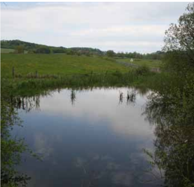
Mare à Saint-Jean-des-Ollières

La responsabilité du Parc Livradois-Forez est importante dans le maintien des espèces patrimoniales encore présentes, notamment pour les 88 taxons jugés prioritaires d'après le diagnostic de la flore. Celui-ci comporte des éléments précis sur les facteurs d'influence, les enjeux, les spécificités et les responsabilités du Parc, ainsi que des pistes d'orientations et d'actions, pour cinq groupes d'espèces classés grossièrement par types de milieux et présentant des problématiques et des enjeux de préservation communs.