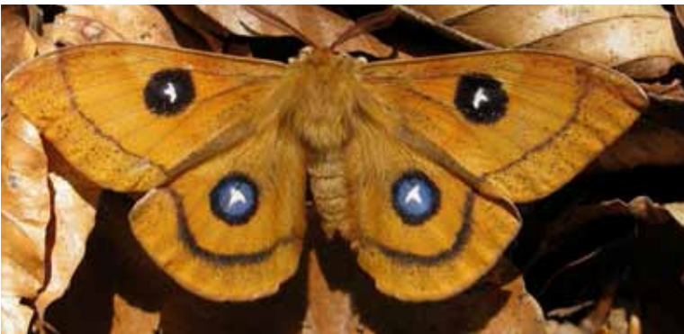
Aglia tau mâle

Au plan départemental, les politiques environnementales des Conseils généraux du Puy-de-Dôme, de la Haute-Loire et de la Loire ne se limitent plus seulement aux schémas des ENS (Espaces Naturels Sensibles). Différents services sont impliqués dans une approche dynamique autour de la biodiversité (routes, cours d'eau, stratégie pour les espèces faunistiques patrimoniales de la Loire par exemple...).