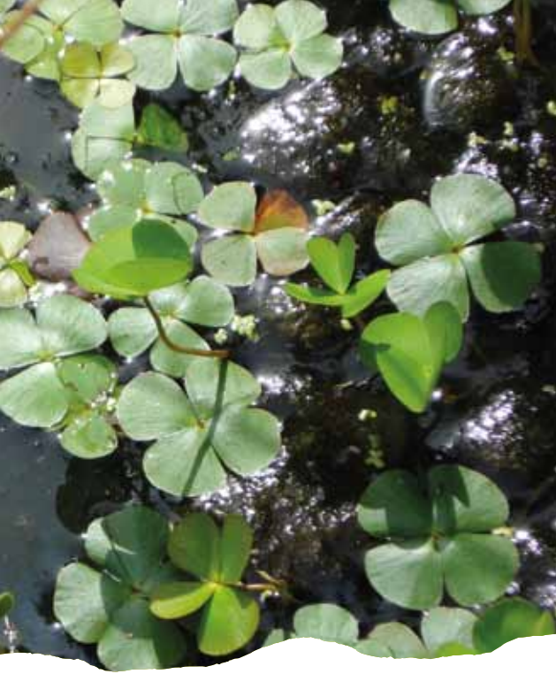
Marsillée à quatre feuilles