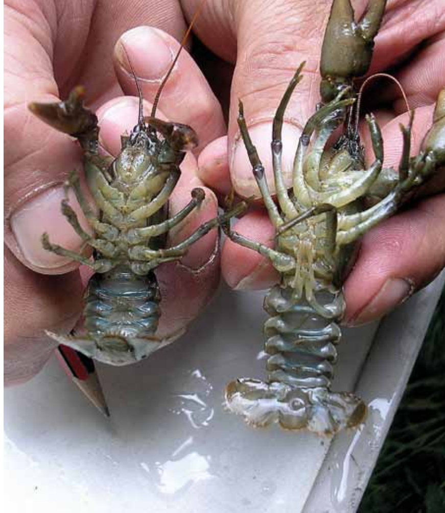
Ecrevisses à pattes blanches

→ Un suivi particulier des zones de contact des deux vipères Péliade et Aspïc serait intéressant.