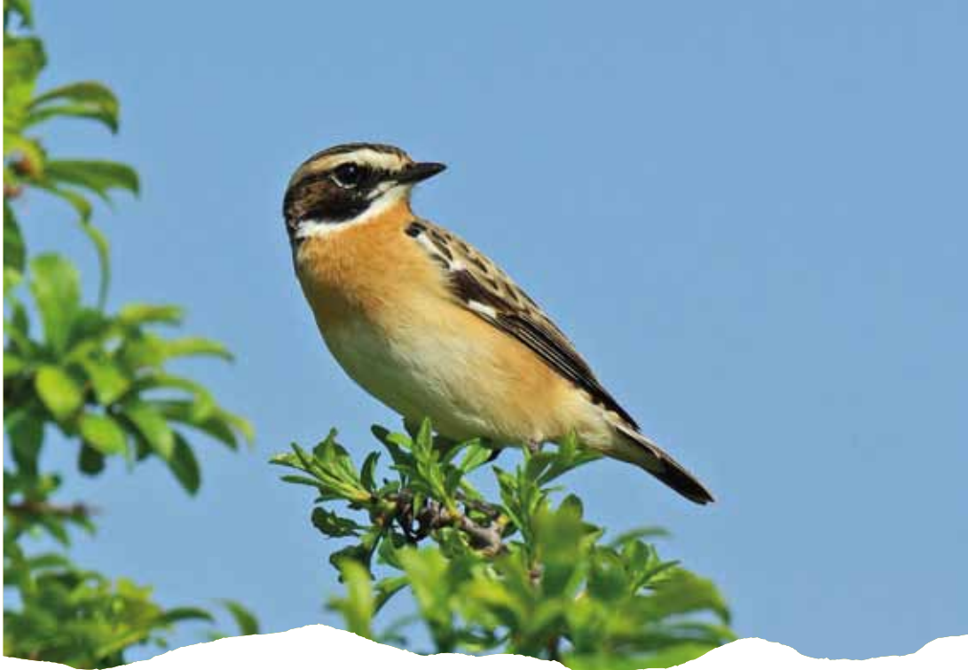
Tarier des prés