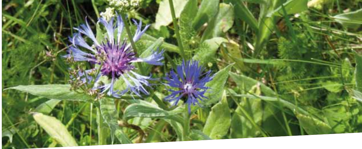
Centaurée des montagnes