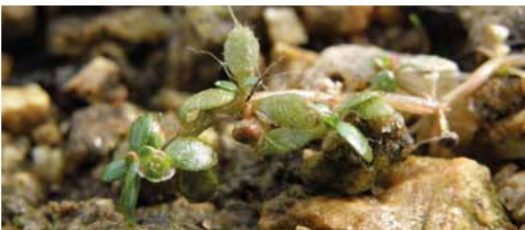
Elatine à six étamines