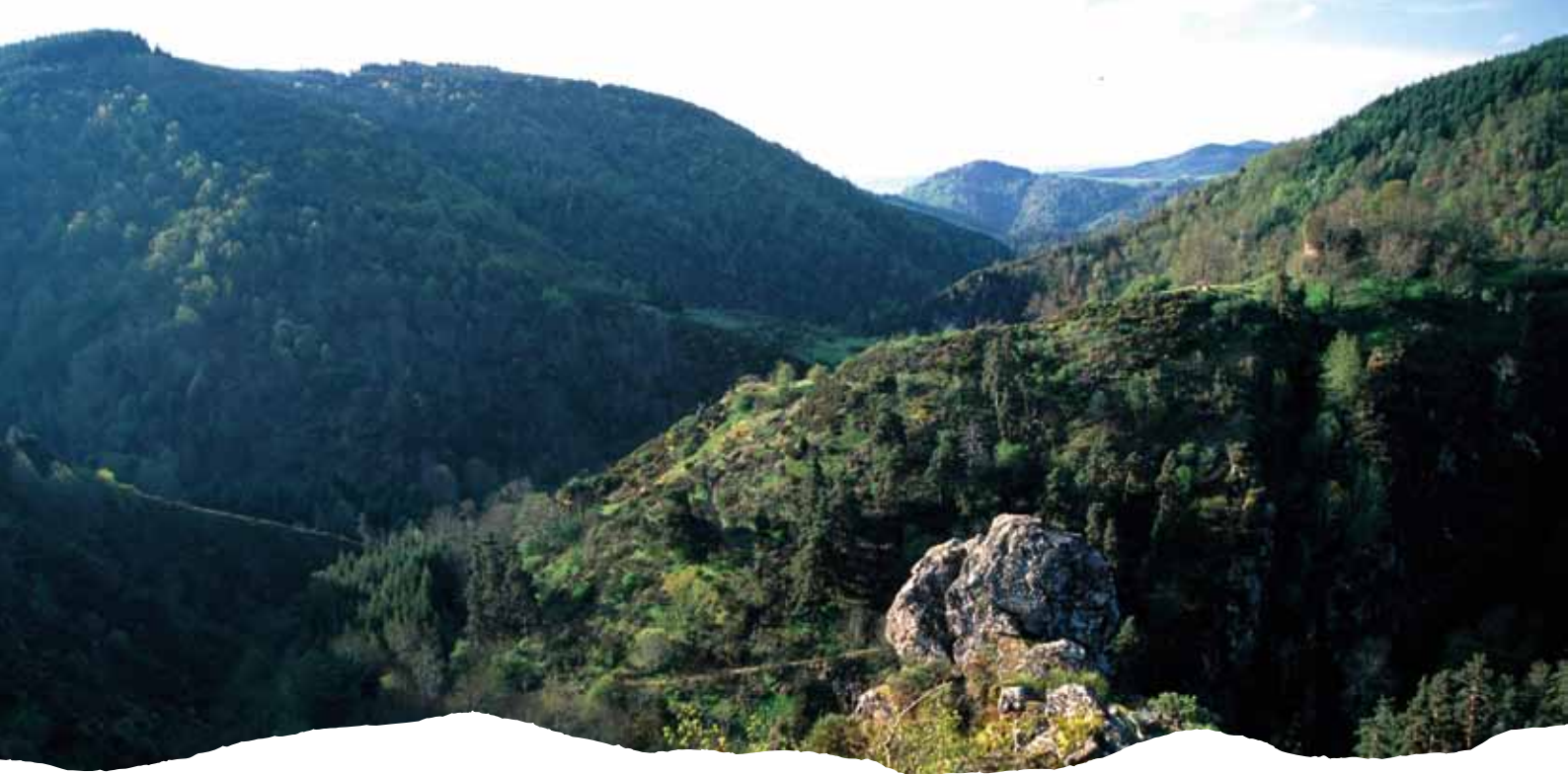
Gorges de l'Arzon