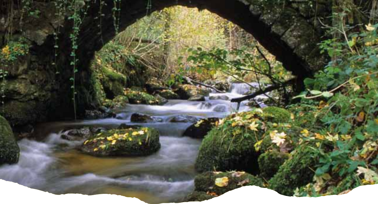
Pont sur le Batifol