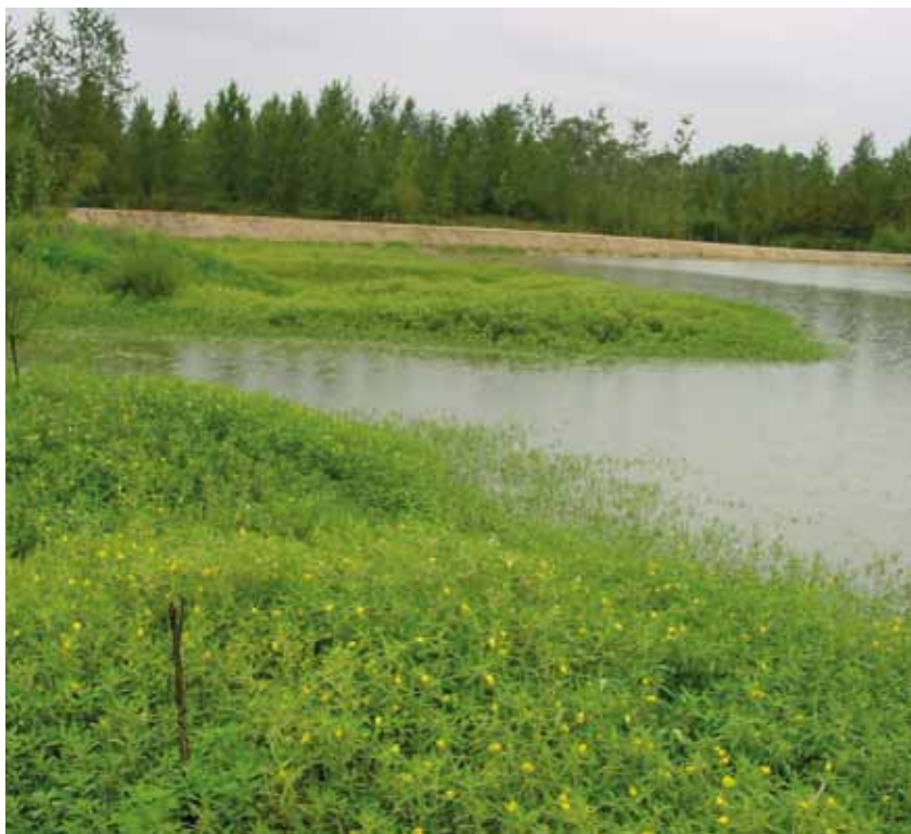
Jussie sur la Dore à Dorat

La progression des espèces exotiques envahissantes entraîne la disparition de certaines espèces à fort intérêt patrimonial par une concurrence directe et d'habitats rares et fragiles tels que les forêts alluviales à bois tendre envahies par des boisements d'Erables négundo et d'Ailanthé ; elle peut aussi poser des problèmes d'instabilité des berges, de dommages aux cultures (Ragondin, Rat musqué, Ambroisie), de santé publique (Ambroisie, Berce du Caucase, Ragondin, Rat musqué), ou encore de perception paysagère.